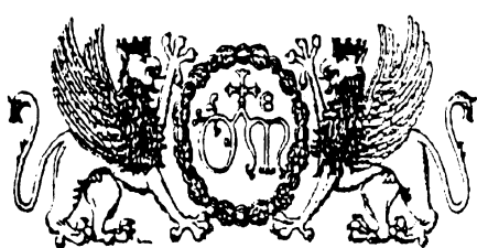
Stemmi dell'Ospedale di S. Maria della Misericordia di Perugia