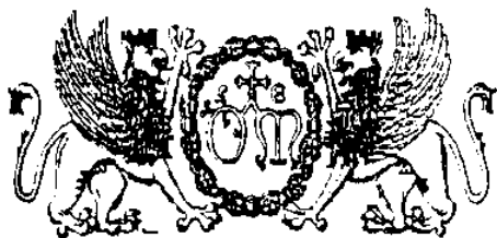
Stemmi dell'Ospedale di S. Maria della Misericordia di Perugia