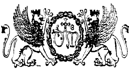
Stemmi dell'Ospedale di S. Maria della Misericordia di Perugia