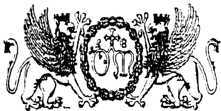
Stemmi dell'Ospedale di S. Maria della Misericordia di Perugia