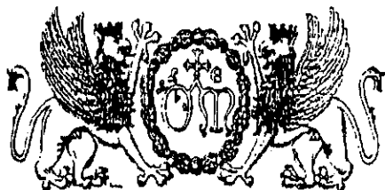
Stemmi dell'Ospedale di S. Maria della Misericordia di Perugia