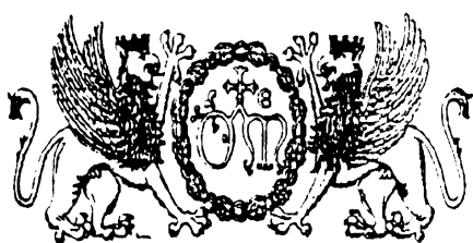
Stemmi dell'Ospedale di S. Maria della Misericordia di Perugia